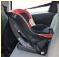
目安：新生児～1歳半頃